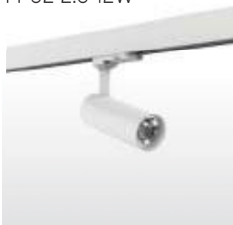
TT-02 2.0 12W

Светильники монтируются на 3х фазный шинопровод Varton™